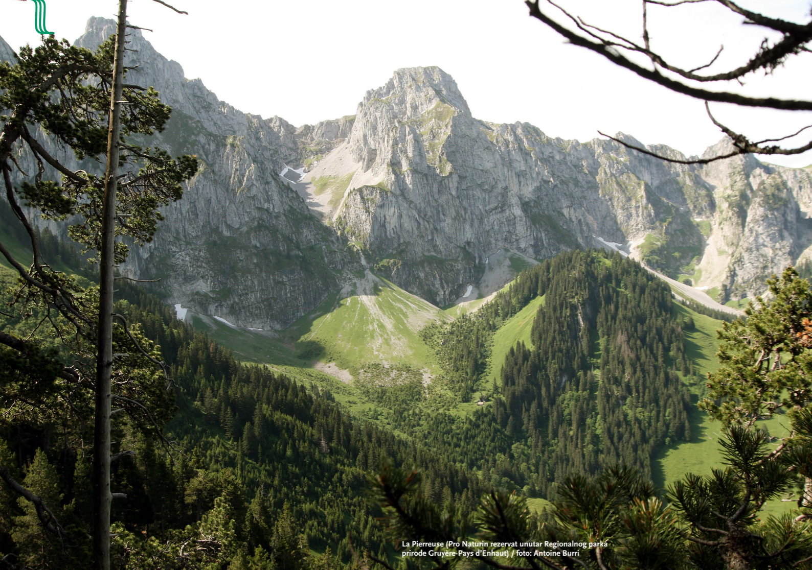
La Pierreuse (Pro Naturin rezervat unutar Regionalnog parka prirode Gruyère-Pays d'Enhaut)