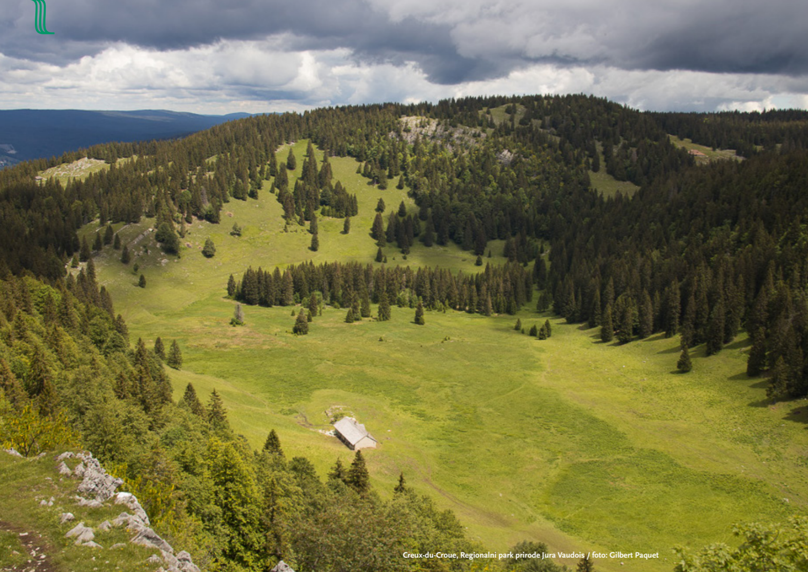
Creux-du-Croux, Regionalni park prirode Jura Vaudois