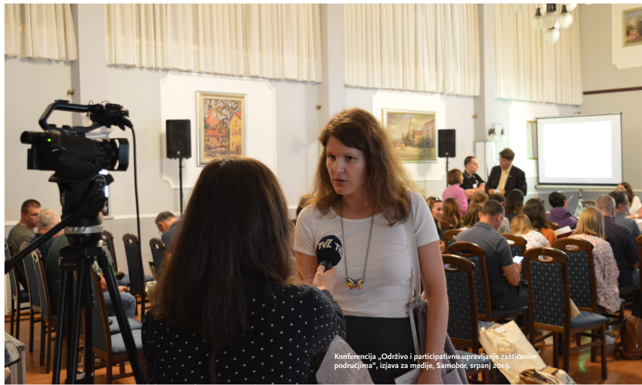
Konferencija „Održivo i participativno upravljanje zaštićenim područjima“, izjava za medije, Samobor, srpanj 2019.

2007. godine 26 , a 2013. godine 27 je, u smanjenom obimu, integrirana u europsku ekološku mrežu Natura 2000. 28 Ekološka mreža RH obuhvaća 36,67% kopnenog teritorija i 16,26% obalnog mora 29 , odnosno gotovo 30% ukupnog državnog teritorija. Trenutno se sastoji od 745 područja očuvanja značajnih za vrste i stanišne tipove (proglašena temeljem Direktive o staništima) 30 te 38 područja očuvanja značajnih za ptice (proglašena temeljem Direktive o pticama) 31 . Značajan udio površine mreže Natura 2000 (26,86 %) već je zaštićen u jednoj od devet nacionalnih kategorija zaštićenih područja, dok se čak 90,80 % ukupne površine područja zaštićenih u nacionalnim kategorijama nalazi unutar mreže Natura 2000. 32