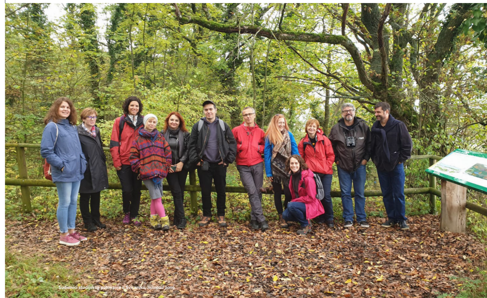
Sudionici studijskog putovanja u Švicarsku, listopad 2019.