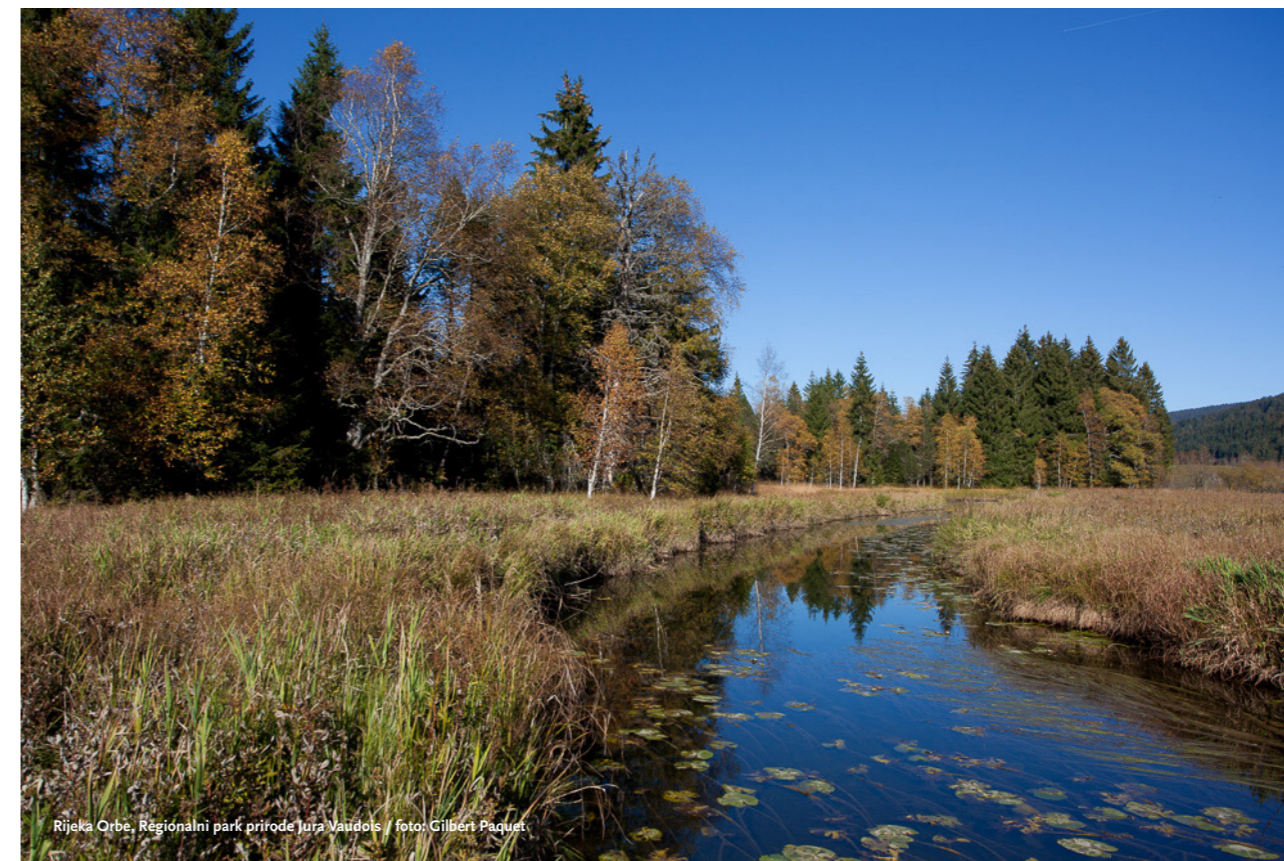
Rijeka Orbe, Regionalni park prirode Jura Vaudois

iznesena tijekom rasprava nastoji u najvećoj mogućoj mjeri uklopiti u planove upravljanja.