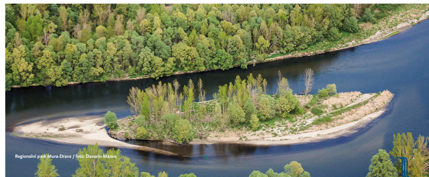
Regionalni park Mura-Drava

Hrvatski zakonodavni okvir trenutno ne predviđa druge međunarodno poznate modele upravljanja, s drugačijim nadležnostima (modeli B, C i D iz tablice 3). Iako u Zakonu o zaštiti prirode postoji mehanizam za djelomično delegiranje upravljanja (podtip modela A) te se pod određenim uvjetima skrb nad zaštićenim područjem (uključujući i područja ekološke mreže) može povjeriti trećoj osobi (ZoZP, čl. 149-150), i u tom slučaju odgovornost za upravljanje i dalje ostaje na odgovarajućoj JU. Međutim, čak ni taj mehanizam