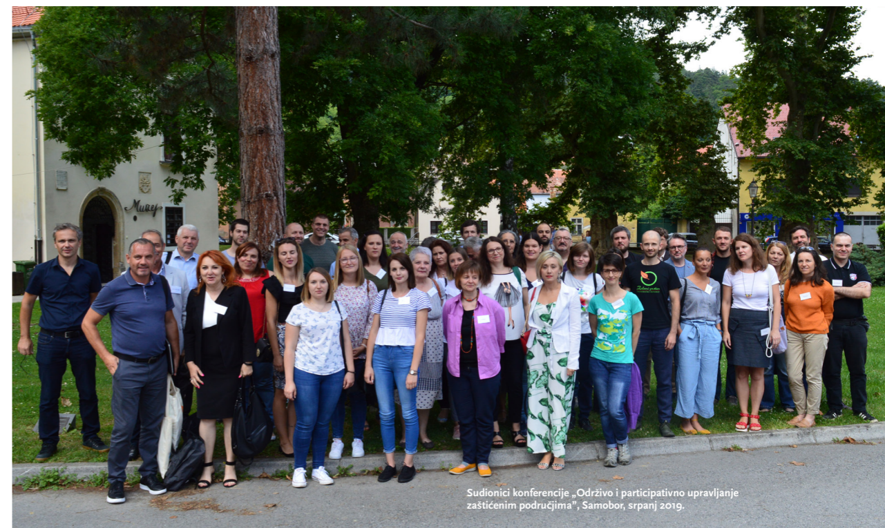
Sudionici konferencije „Održivo i participativno upravljanje zaštićenim područjima“, Samobor, srpanj 2019.

često ne navode na popisima zaštićenih područja, mnoga od tih područja prema ciljevima zaštite usporediva su s pojedinim IUCN kategorijama. Među najznačajnijima u ovoj skupini (ako zbog ničeg drugog, onda zbog površine koju pokrivaju) svakako su regionalni parkovi prirode koji približno odgovaraju IUCN kategoriji V. O ovom tipu područja više će biti rečeno u nastavku publikacije.