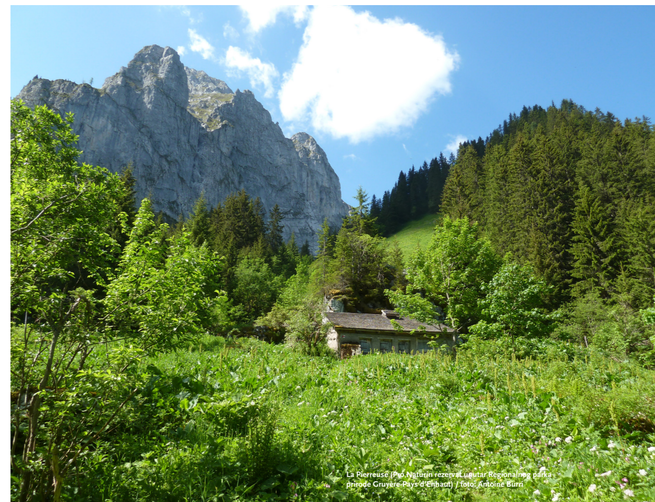
La Pierreuse (Pro Naturin rezervat unutar Regionalnog parka prirode Gruyère-Pays d'Enhaut)