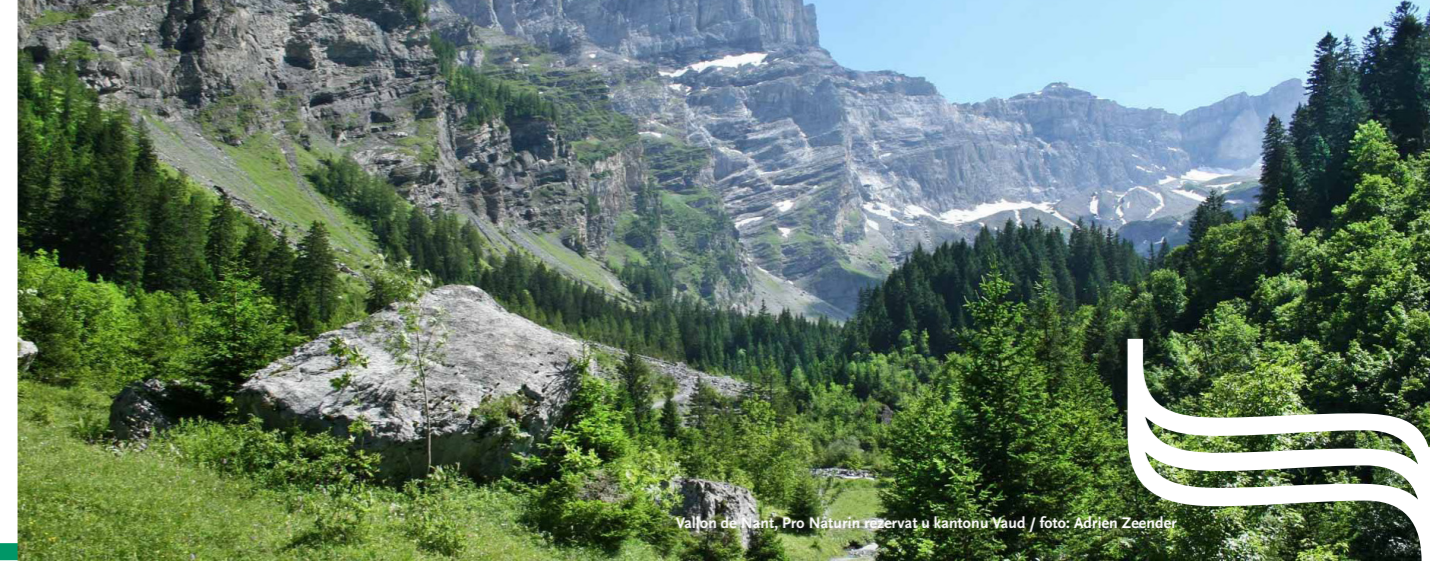
Vallon de Nant, Pro Naturin rezervat u kantonu Vaud