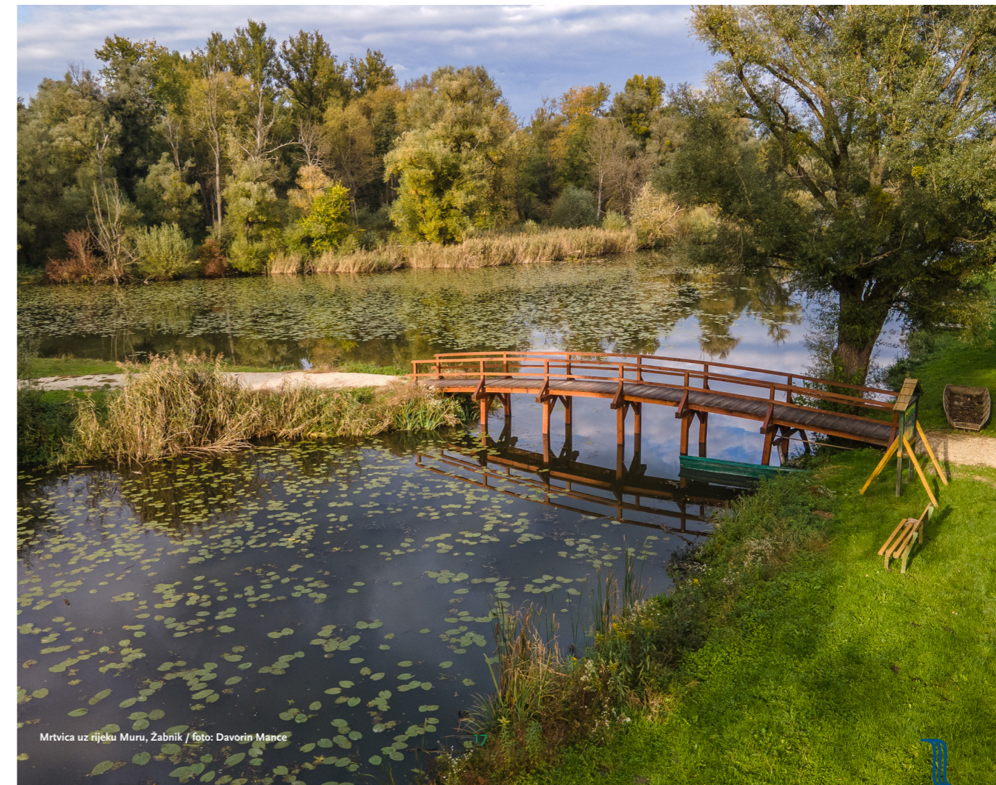
Mrtvica uz rijeku Muru, Zabnik