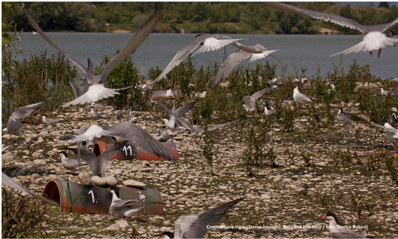
Crvenokljuna cigra ( Sterna hirsundo ), Sava kod Hrušćice

predsjednika bira Federalno vijeće (OPN, čl. 24, stavak 1). Osim savjetovanja različitih federalnih i kantonalnih tijela vezano uz pitanja zaštite prirode, Komisija ima ulogu i u pripremi i revizijama popisa područja od nacionalnog značaja, kao i u pripremi stručnih mišljenja vezano uz projekte koji bi mogli štetno utjecati na takva područja (OPN, čl. 25).