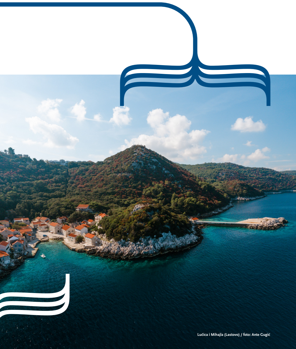
Lučica i Mihajla (Lastovo)