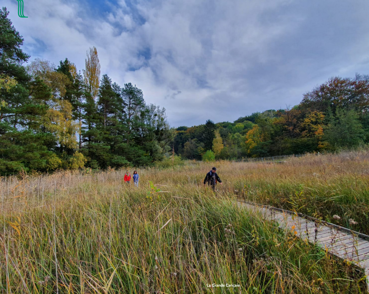
La Grande Cariçaille