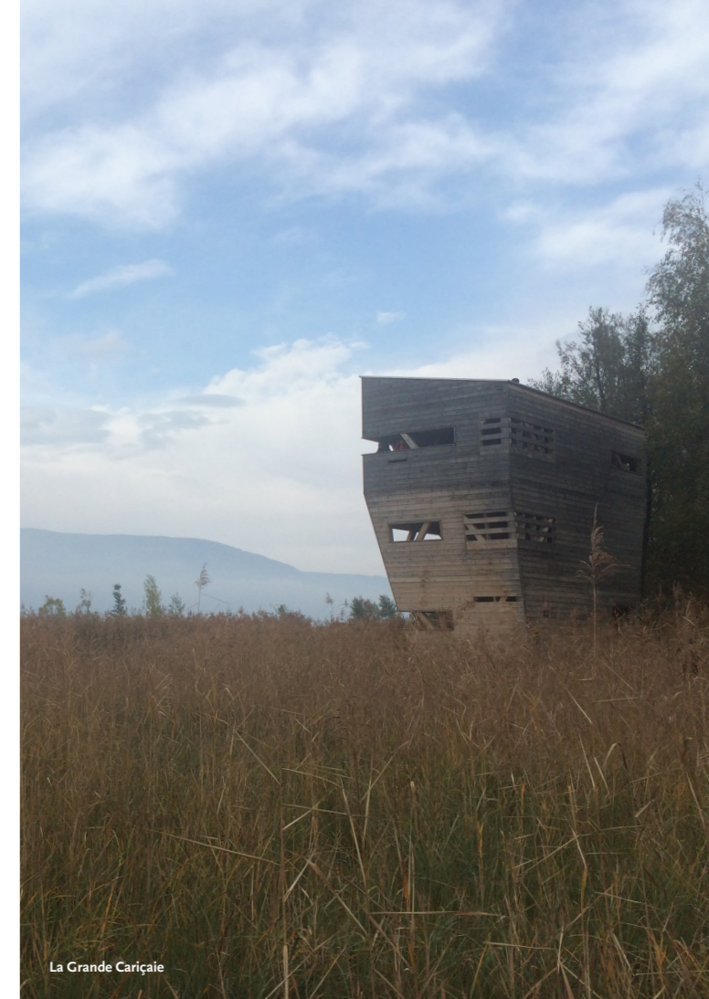
La Grande Cariçaille

Područje ima izrađen plan upravljanja za period 2012. – 2023. a za njegovo provođenje osigurano je financiranje od 1,7 milijuna CHF godišnje putem programskog ugovora između Konfederacije i kantona.